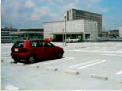
中部国際空港セントレア