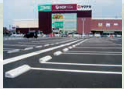
グラッチェタウン西尾